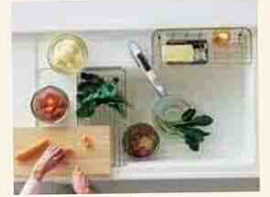
PaPaPa シンク スペース広びろ 洗い物らくらく。