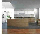
Lクラス キッチン グラリオカウンターが映える 空間でふたりの時間を満喫。