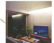
スピーカー付ダウンライト リビング中央に取り付けると、 天井からサウンドが降りそそぐ。